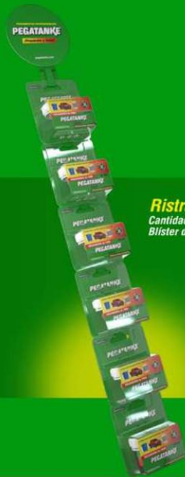
Ristra Cantidad: 6 Blister de Epóxicos